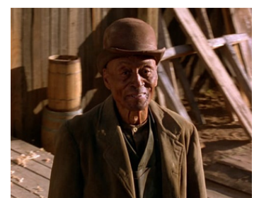
1995 MORT OU VIF (The Quick and the Dead) de Sam Raimi