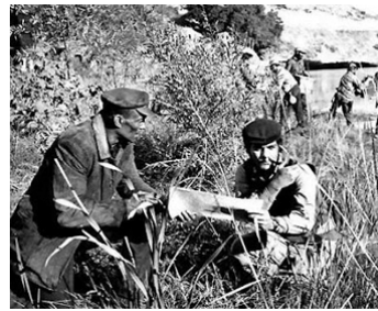
1969 CHE ! (Che !) de Richard Fleischer avec Omar Sharif