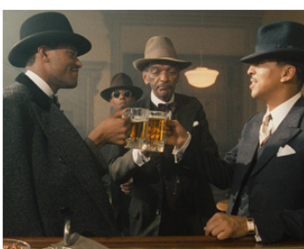
1984 COTTON CLUB (Cotton Club) de Francis Ford Coppola avec L. Fishburne, G Hines