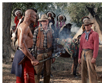
1961 LES DEUX CAVALIERS (Two Rode Together) de John Ford avec J. Stewart, Richard Widmark