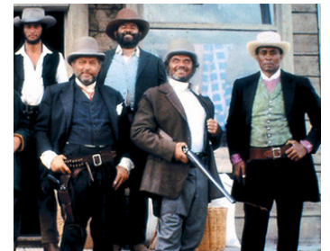
1972 LA POURSUITE SAUVAGE (The Revengers) de Daniel Mann avec Ernest Borgnine