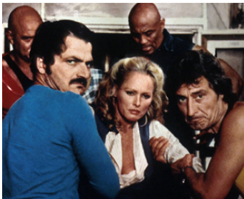
1975 URSULA L'ANTI-GANG (Colpo in canna) de Fernando Di Leo avec Ursula Andress