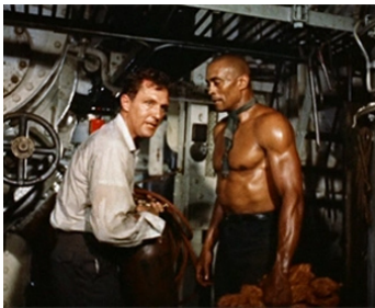
1960 PANIQUE À BORD (The Last Voyage) d'Andrew L. Stone avec Robert Stack