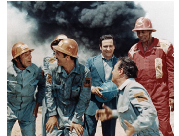
1976 LES AVENTURIERS DE L'OR NOIR (Cuibul salamandrelor) de Mircea Dragan