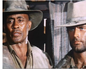
1969 TRINITA VA TOUT CASSER (La Collina degli stivali) de G. Colizzi avec Terence Hill