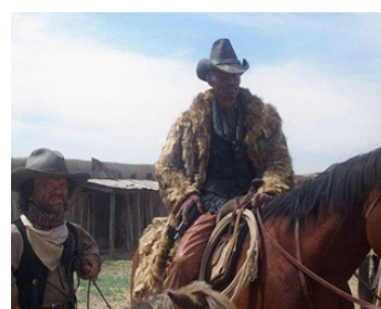
1985 LUST IN THE DUST de Paul Bartel avec Daniel Frishman