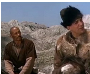
1964 GENGHIS KHAN (Dzingsi Kan) d'Henry Levin avec Telly Savalas