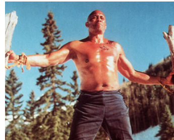
1975 LE FAUCON BLANC (Winterhawk) de Charles B. Pierce