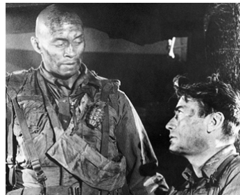
1959 LA GLOIRE ET LA PEUR (Pork Chop Hill) de Lewis Milestone avec Gregory Peck