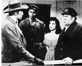
1954 THE GAMBLER FROM NATCHEZ d'Henry Levin avec D. Robertson, D. Paget, Th. Gomez