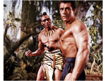
1958 LE COMBAT MORTEL DE TARZAN d'H. Bruce Humberstone avec Gordon Scott