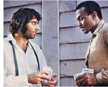
1970 THE LAST REBEL de Denys McCoy avec Joe Namath