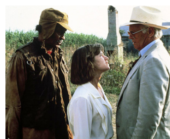
1987 COLÈRE EN LOUISIANE (A Gathering of Old Men) de V. Schlöndorff avec H. Hunter, R. Widmark