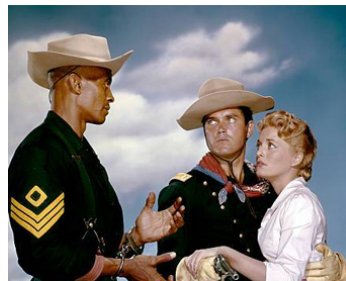
1960 LE SERGENT NOIR (Sergent Rutledge) de John Ford avec Jeffrey Hunter, C. Towers