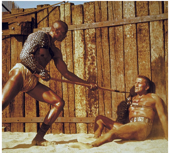
1960 SPARTACUS (Spartacus) de Stanley Kubrick avec Kirk Douglas