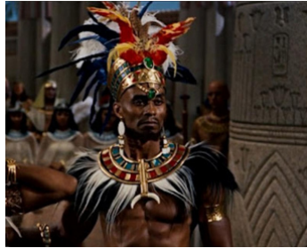
1956 LES 10 COMMANDEMENTS (The Ten Commandments) de Cecil B. DeMille