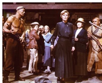
1965 FRONTIÈRE CHINOISE (Seven Women) de John Ford avec A. Bancroft, M. Leighton