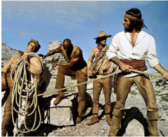
1969 LES DYNAMITEROS (La spina dorsale del diavolo) de Niksa Fulgosi avec Bekim Fehmau