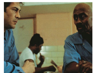
1983 VIGILANTE, JUSTICE SANS SOMMATION (Vigilante) de William Lustig avec Robert Forster