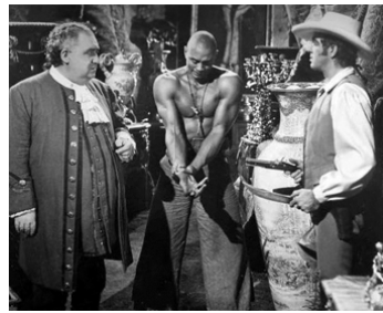
1952 LE TRÉSOR DES CARAÏBES (Caribbean) d'Edward Ludwig avec F. Sullivan, John Payne