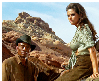
1966 LES PROFESSIONNELS (The Professionals) de Richard Brooks avec Claudia Cardinale