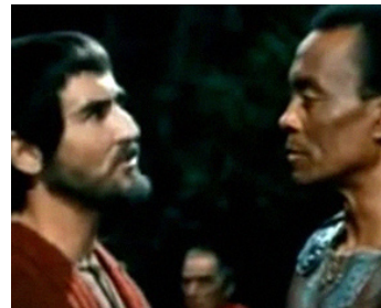
1971 SCIPIONE DETTO ANCHE L'AFRICANO de Luigi Magni avec Vittorio Gassman