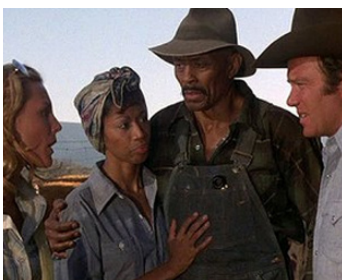
1977 L'HORRIBLE INVASION (Kingdom of the Spiders) de J. Cardos avec A. Davis, W. Shatner