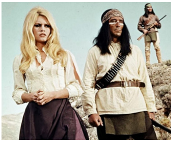
1968 SHALAKO (Shalako) d'Edward Dmytryk avec Brigitte Bardot