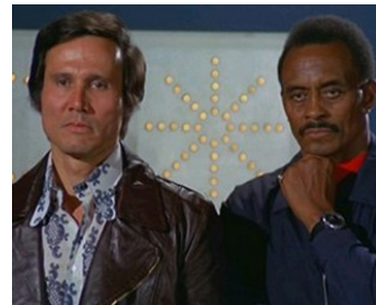
1972 L'EMPIRE DU CRIME (La Mala Ordina) de Fernando Di Leo avec Henry Silva