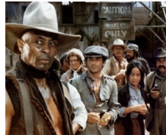
1976 KEOMA (Django il vindicatore) d'Enzo G. Castellari