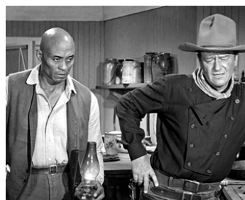
1962 L'HOMME QUI TUA LIBERTY VALANCE de John Ford avec John Wayne