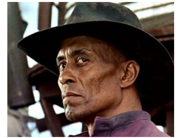
1969 IL ÉTAIT UNE FOIS DANS L'OUEST (C'era una volta il West) de Sergio Leone