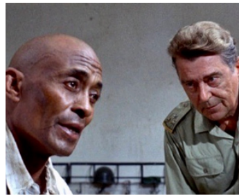
1968 BLACK JESUS (Seduto alla sua destra) de Valerio Zurlini avec Jean Servais