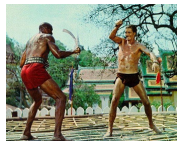
1963 LE DÉFI DE TARZAN (Tarzan's three Challenges) de Robert Day avec Jack Mahoney