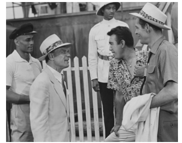
1953 LA CITÉ SOUS LA MER (City beneath the Sea) de B. Boetticher avec A. Quinn, R. Ryan