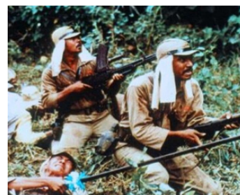
1981 LES AVENTURIERS DE L'OR PERDU (Horror Safari) d'Alan Birkenshaw