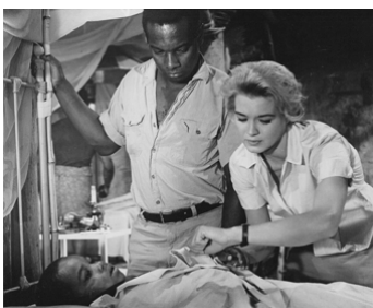
1961 AU PÉRIL DE SA VIE (The Sins of Rachel Cade) de G. Douglas avec Angie Dickinson