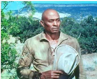
1971 KING GUN (The Gatling Gun) de Robert Gordon